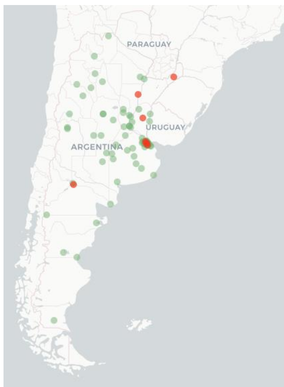
FluTracking Map- COVID-19-like illness symptoms (fever and cough) for week ending 29 May 2022