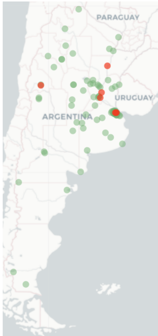
FluTracking Map- COVID-19-like illness symptoms (fever and cough) for week ending 12 June 2022