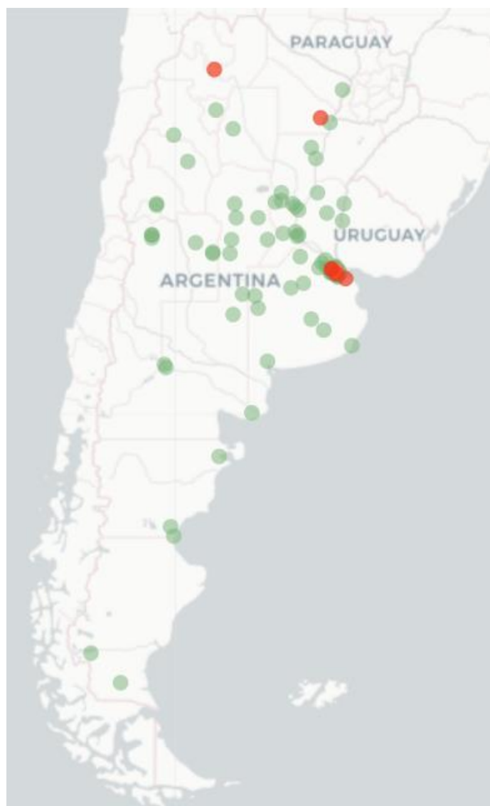
Mapa Flutrackin Sintomas de la Enfermedad tipo COVID-19 (fiebre y Tos) para semana concluida el 7 de Agosto de 2022