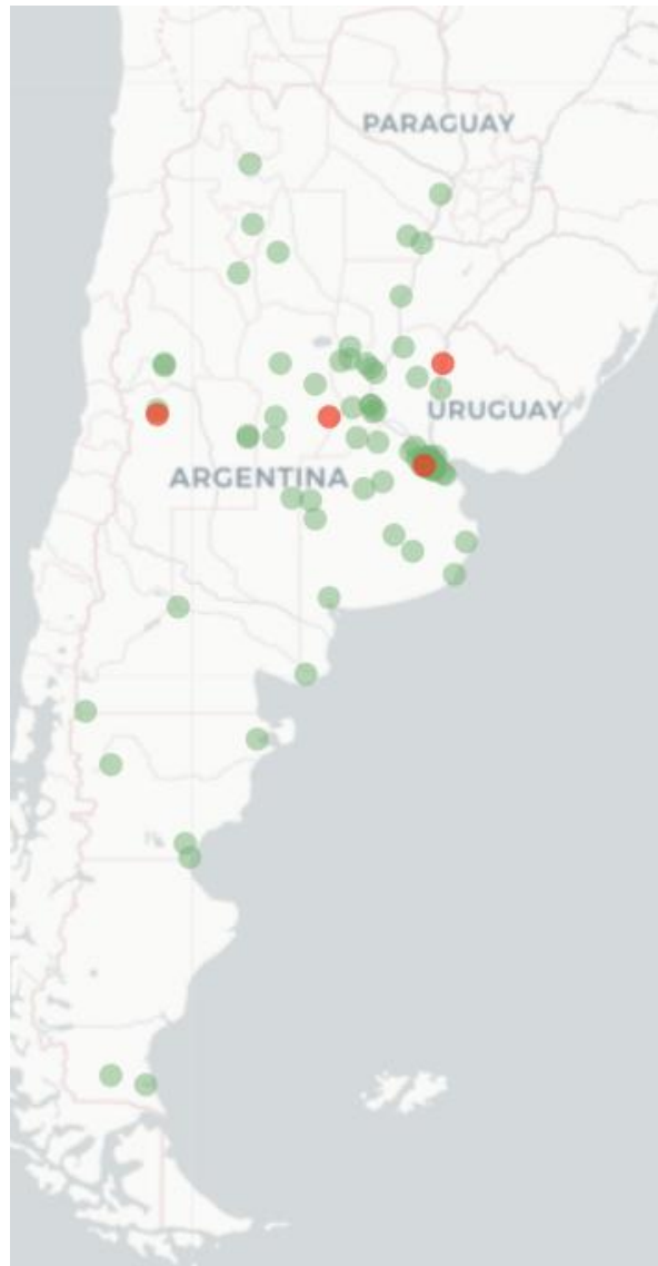
Mapa Flu Tracking Sintomas de la Enfermedad tipo COVID-19 (fiebre y tos) para Semana que termina el 21 de Agosto de 2022