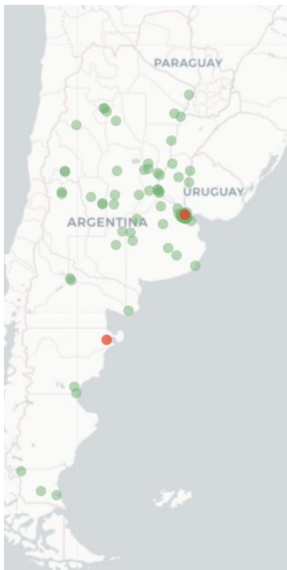
Mapa FluTracking síntoma de la Enfermedad tipo COVID-19 (Fiebre y Tos) semana que termina el 28August 2022