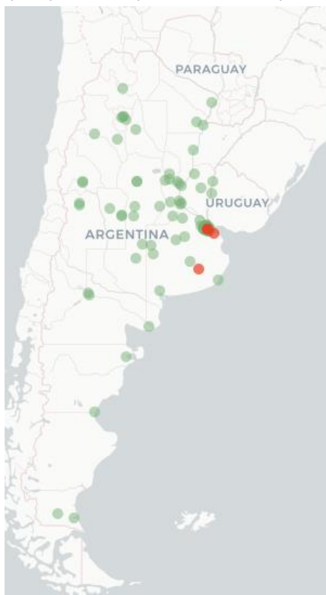
Mapa Flutracking Síntomas de la Enfermedad tipo COVID-19 (Fiebre y Tos) para semana que termina el 11 de Septiembre 2022