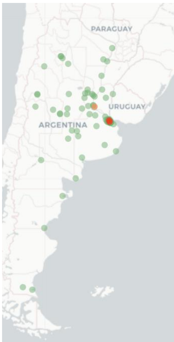
Mapa Flutracking Síntomas de la Enfermedad tipo Covid-19 (Fiebre y Tos) para semana que termina el 9 Octubre de 2022