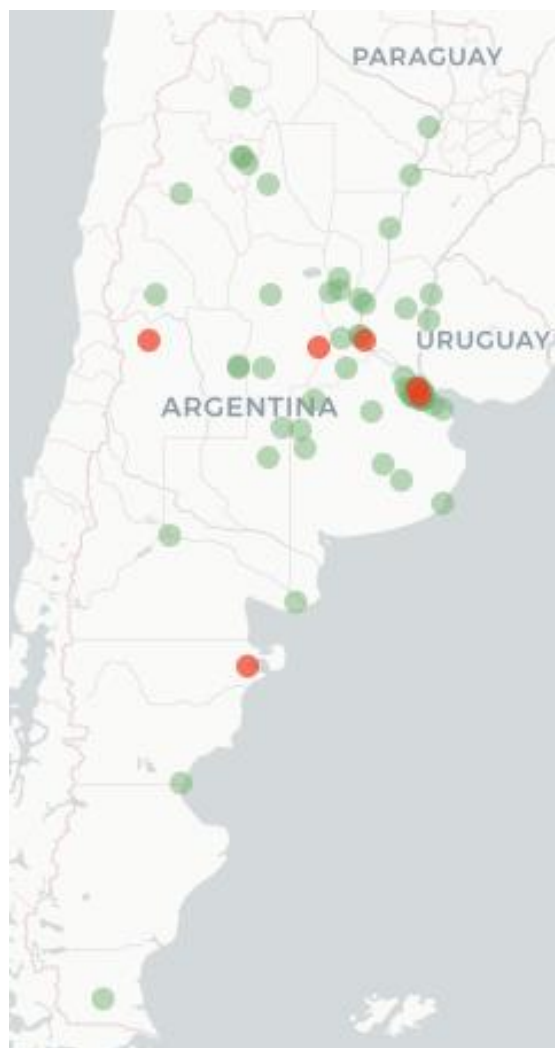
Mapa Flutracking síntomas de la Enfermedad Tipo COVID-19 (Fiebre y Tos) para semana que termina el 16 de Octubre 2022