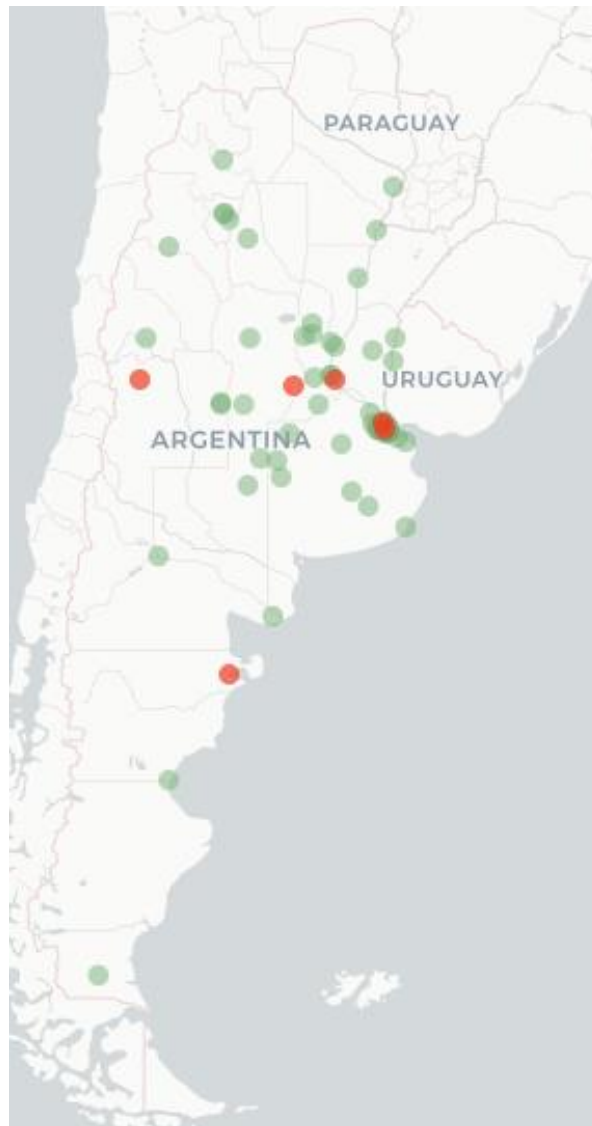
Mapa Flutracking síntomas de la Enfermedad tipo COVID-19 (Fiebre y Tos) para semana que termina el 23 de Octubre de 2022