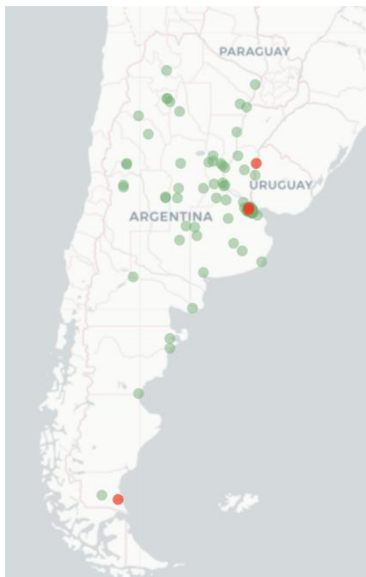
Mapa Flutracking Síntomas de la Enfermedad tipo COVID-19 (fiebre y Tos) para Semana que termina el 25 de Septiembre 2022