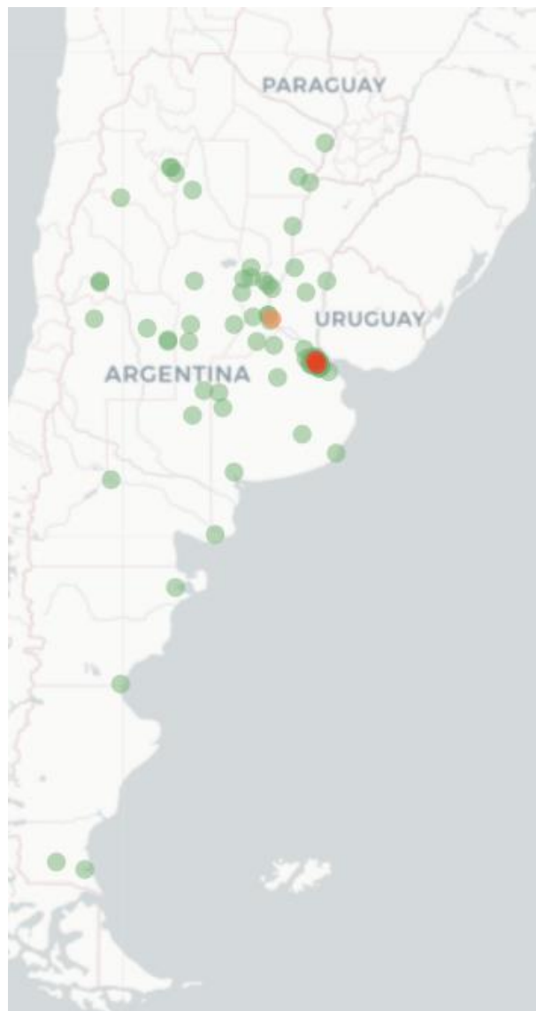
Mapa FluTracking Síntomas de la Enfermedad Tipo COVID-19 (Fiebre y Tos) para Semana Concluyó el 2 de Octubre 2022