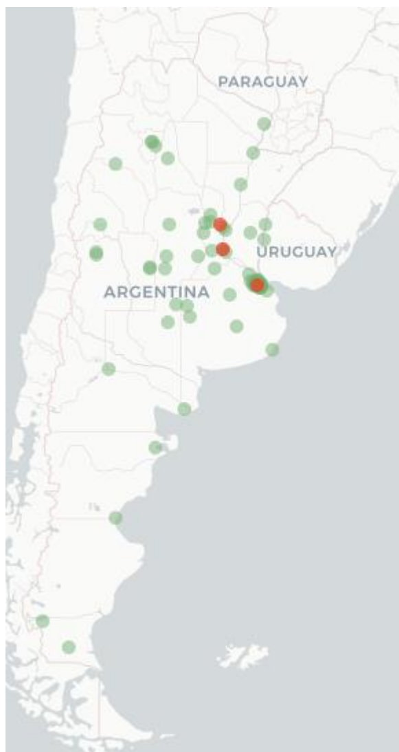
Mapa Flutracking Síntomas de la Enfermedad tipo COVID-19 (Fiebre y Tos) para Semana que Termina el 30 de Octubre 2022