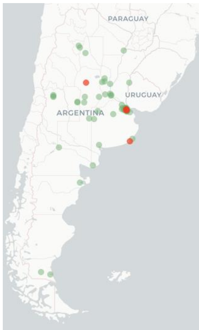
Mapa Flutracking – Síntomas de la Enfermedad tipo COVID-19 a la (Fiebre y Tos) para semana que termina el 27 de Noviembre 2022