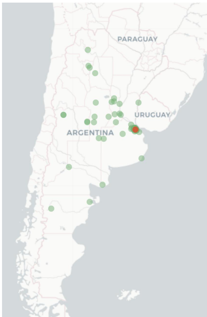
Mapa Flutracking Síntomas de la Enfermedad tipo COVID -19 para Semana que termina el 11 de Diciembre 2022