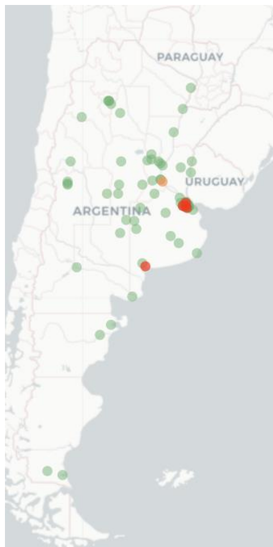
Mapa Flutracking Síntomas de la Enfermedad tipo COVID-19 (Fiebre y Tos) para semana que termina el 13 de Noviembre 2022