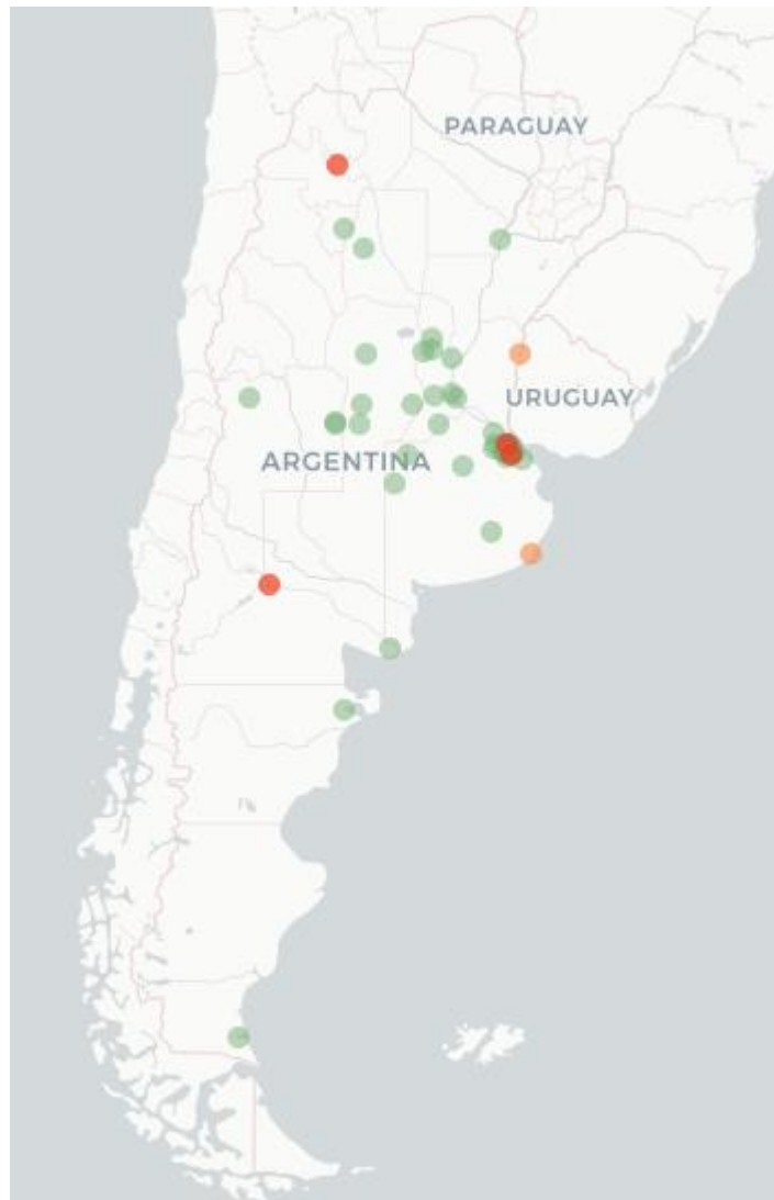
Mapa Flutracking – Síntomas de la Enfermedad tipo COVID -19 (Fiebre y Tos) para semana que termina el 25 Diciembre de 2022