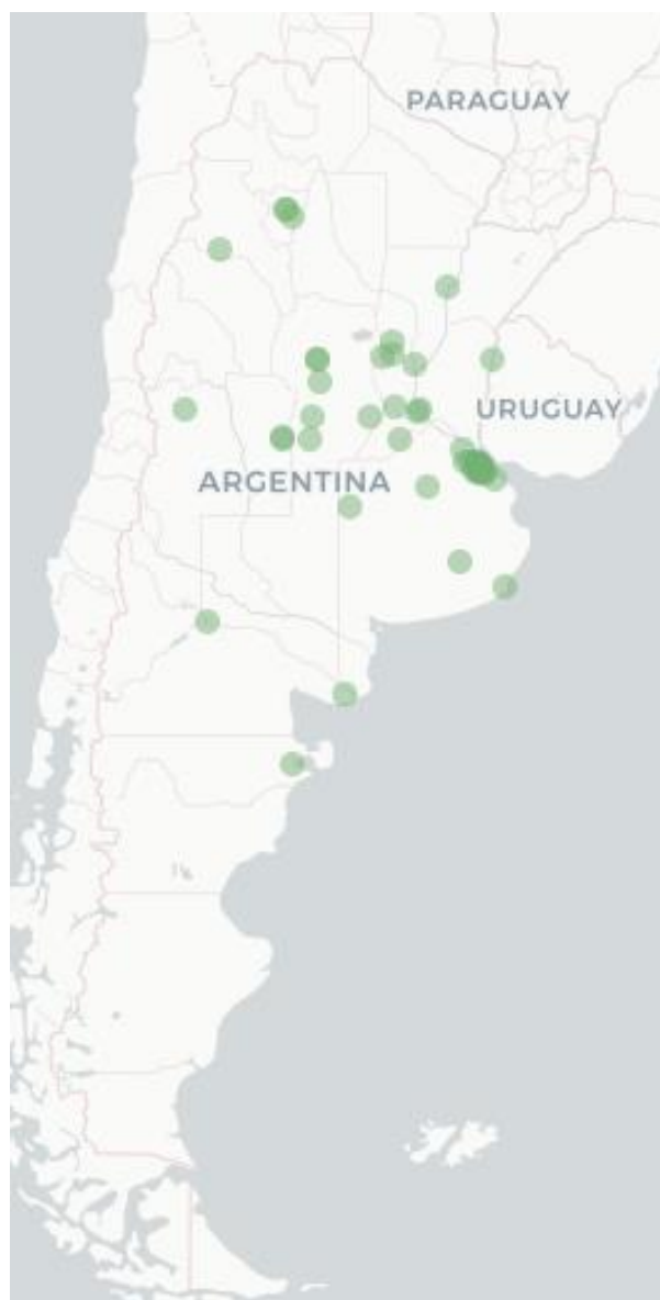
Mapa FluTracking - Síntomas de la Enfermedad tipo COVID -19 (Fiebre y Tos) para semana que termina el 19 Febrero de 2023