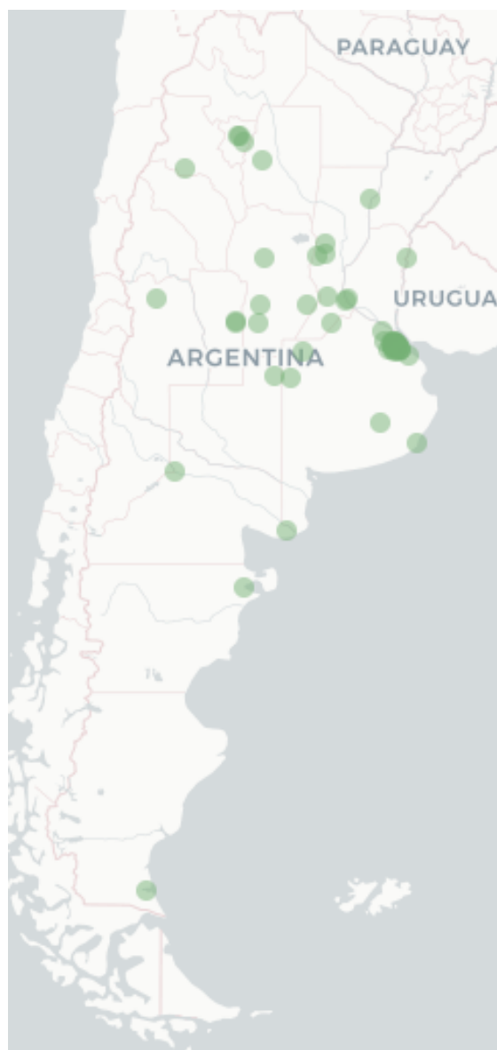
Mapa FluTracking - Síntomas de la Enfermedad tipo COVID -19 (Fiebre y Tos) para semana que termina el 2 Marzo de 2023