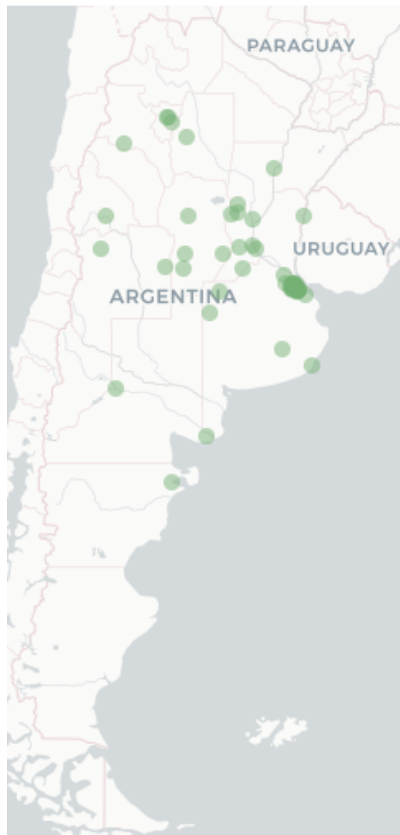
Mapa FluTracking - Síntomas de la Enfermedad tipo COVID -19 (Fiebre y Tos) para semana que termina el 23 Marzo de 2023