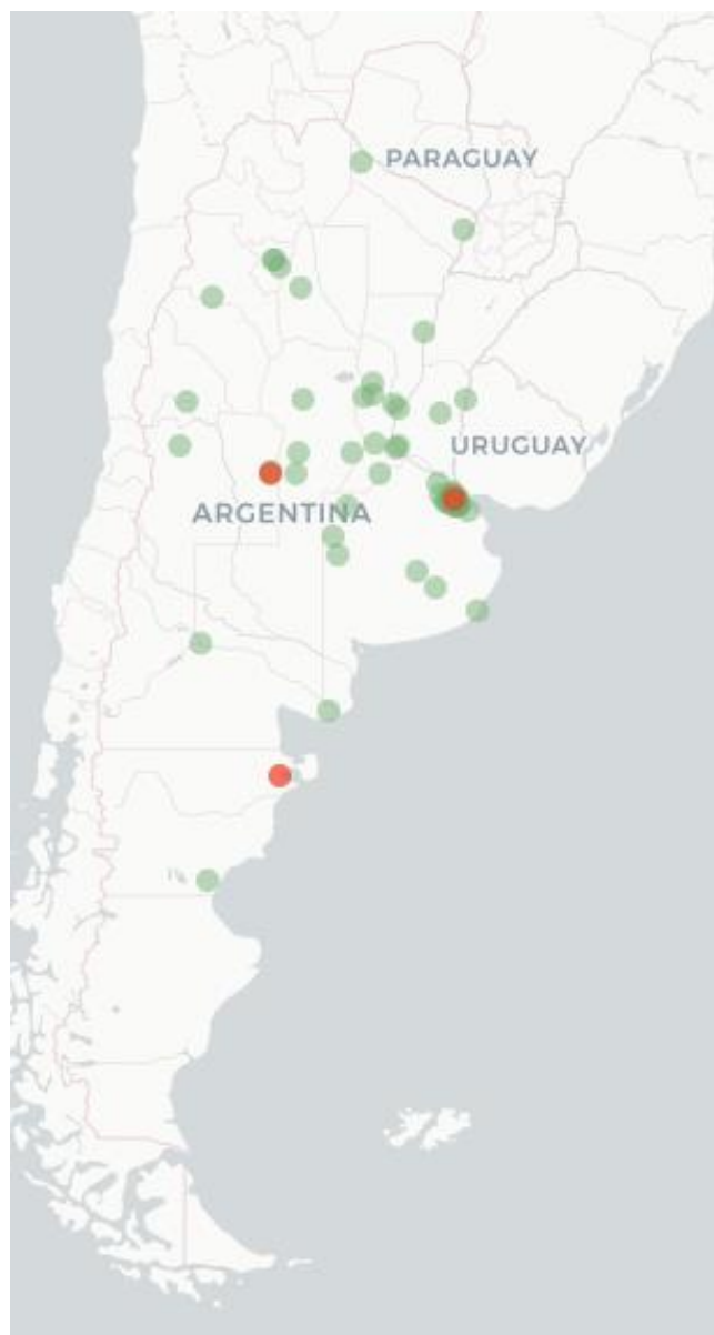
Mapa FluTracking - Síntomas de la Enfermedad tipo COVID -19 (Fiebre y Tos) para semana que termina el 2 Abril de 2023