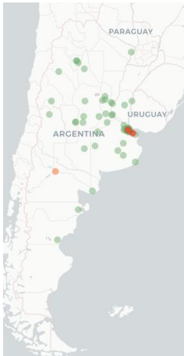
Mapa FluTracking- Síntomas de la Enfermedad tipo COVID -19 (Fiebre y Tos) para semana que termina el 26 Abril de 2023