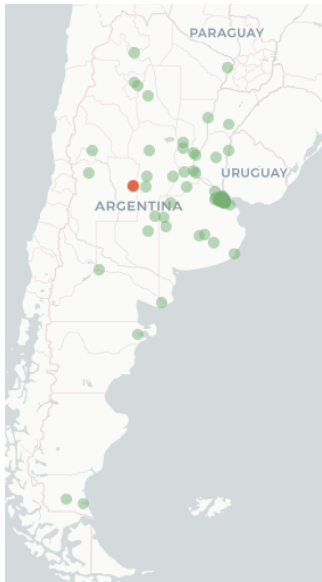
Mapa FluTracking- Síntomas de la Enfermedad tipo COVID -19 (Fiebre y Tos) para semana que termina el 18 mayo de 2023