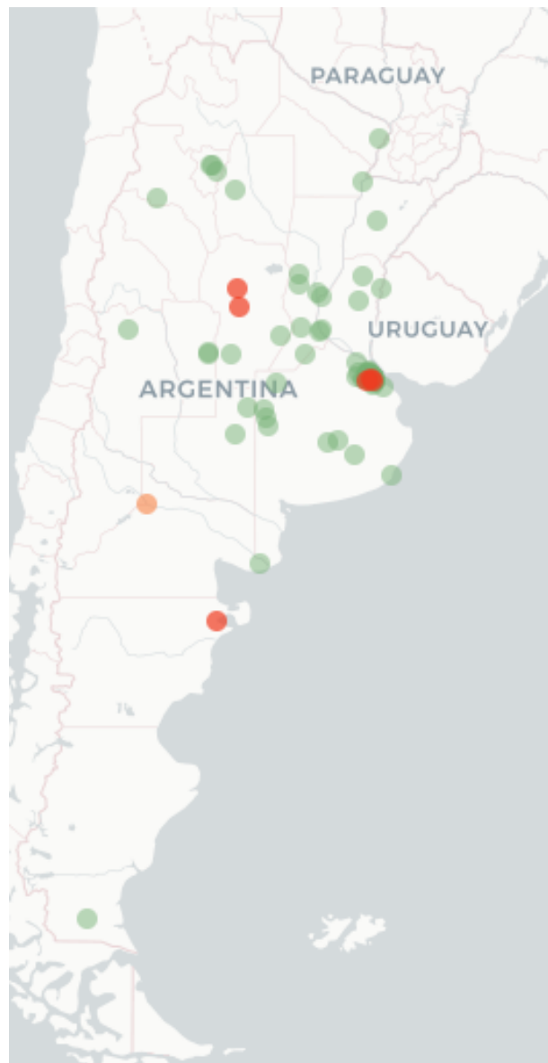
Mapa FluTracking- Síntomas de la Enfermedad tipo COVID -19 (Fiebre y Tos) para semana que termina el 25 mayo de 2023