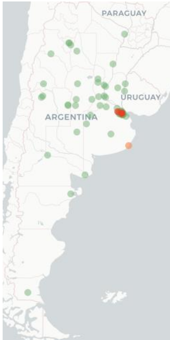
Mapa FluTracking- Síntomas de la Enfermedad tipo COVID -19 (Fiebre y Tos) para semana que termina el 01 junio de 2023