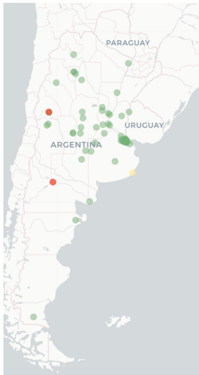
Mapa FluTracking - Síntomas de la Enfermedad tipo COVID -19 (Fiebre y Tos) para semana que termina el 11 junio de 2023