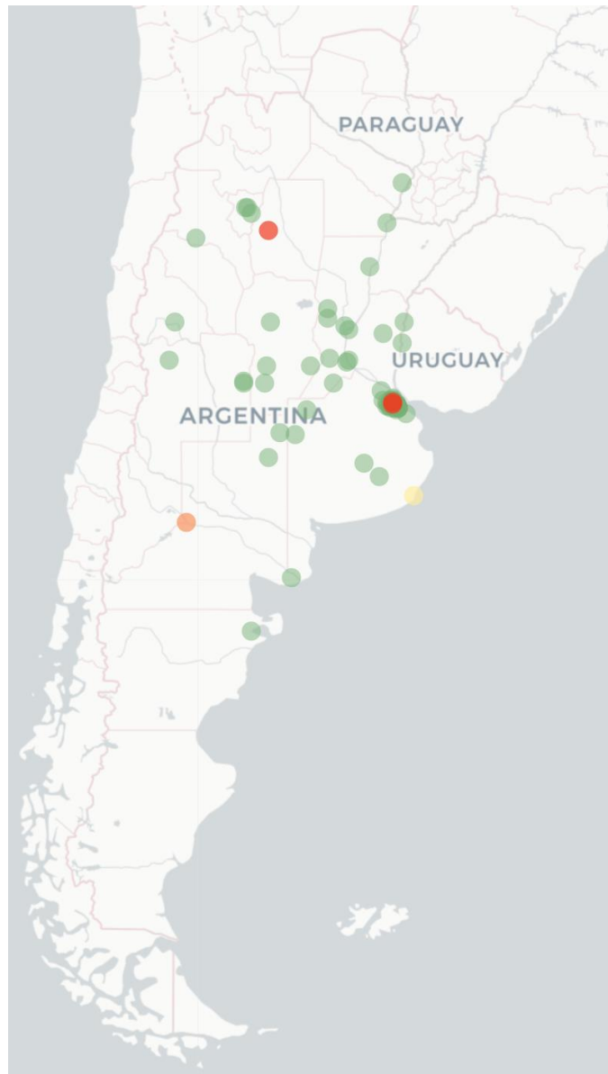
Mapa FluTracking - Síntomas de la Enfermedad tipo COVID -19 (Fiebre y Tos) para semana que termina el 18 junio de 2023