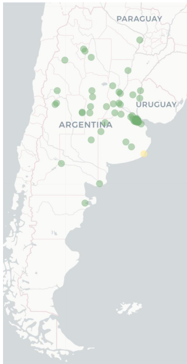
Mapa FluTracking - Síntomas de la Enfermedad tipo COVID -19 (Fiebre y Tos) para semana que termina el 9 julio de 2023